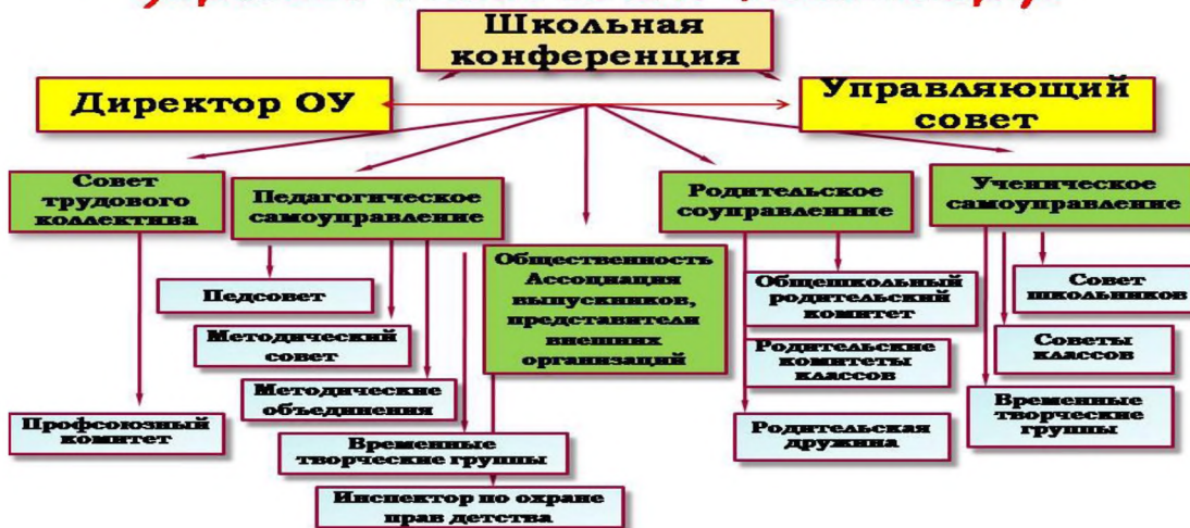
Схема организации государственно-общественного управления в МБОУ СОШ №4 г. Светлограда