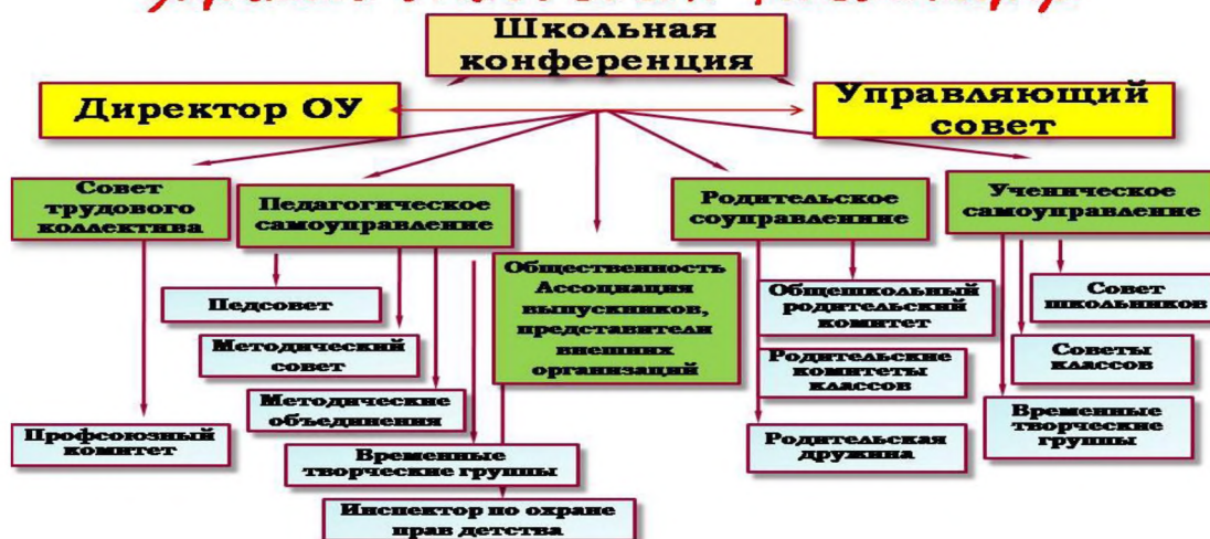
Схема организации государственного управления в МБОУ СОШ №4 г. Светлогорск